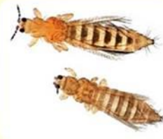
ตัวเต็มวัยของเพลี้ยไฟ

เดือนเกษตรกรทำนา ในพื้นที่บริเวณฝนทิ้งช่วงนานติดต่อกัน หรือนาสภาพขาดน้ำ ระวัง เพลี้ยไฟ เข้าทำลายข้าวที่อยู่ใน ระยะกล้า หรือหลังปักดำ 2-3 สัปดาห์ เพลี้ยไฟทั้งตัวอ่อนและตัวเต็มวัยจะทำลายข้าวโดยการดูดกินน้ำเลี้ยง จากใบข้าวที่ยังอ่อนโดยอาศัยอยู่ตามซอกใบ เมื่อใบข้าวโตขึ้นใบที่ถูกทำลายปลายใบจะเหี่ยวขอบใบจะม้วนเข้าหากกลางใบและอาศัยอยู่ในใบที่ม้วนนั้น