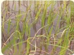
ใบข้าวที่แสดงปลายใบม้วน