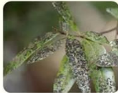
ลักษณะการเข้าทำลายของเพลี้ยจักจั่นมะม่วง