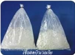
เชื้อสัคบิวเวอเรีย