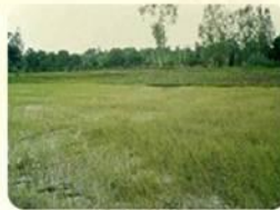
สภาพนาข้าวที่เพลี้ยไม่ไร้ระบบรุนแรง