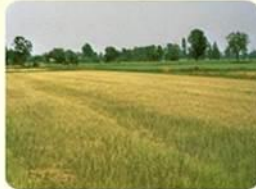
ลักษณะการทำลายของเพลี้ยไฟ